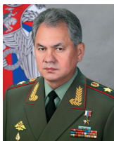
Герой Российской Федерации генерал армии ШОЙГУ Сергей Кужугетович